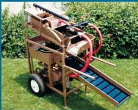
Goldheld Explorer II

Мы являемся дилерами и эксклюзивными представителями в России ведущих американских и других производителей промприборов, драг, обогатительных столов, портативных дробилок, сепараторов и других приборов и принадлежностей.