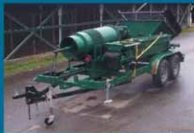
Пионер Орегона - 15